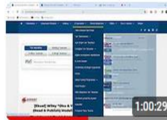
SAÜ Kütüphane Online Kullanıcı Eğitimi