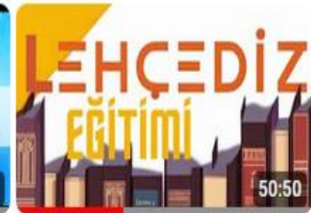
"Dil ve Kültür Araştırmaları Odağında Teknolojik...