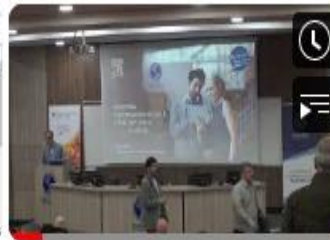
SCIVAL Platformu ile 'Araştırma Performansını...