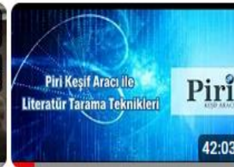
Piri Keşif Aracı - Sakarya Üniversitesi Kullanıcı Eğitimi